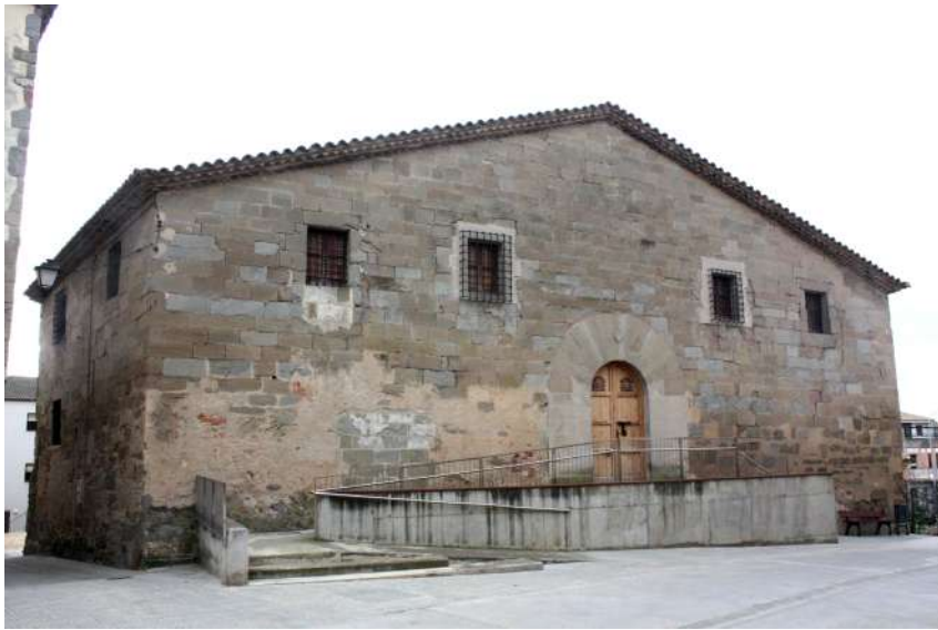
Edifici de La Panera a Castellserà, on hi havia hagut el castell.